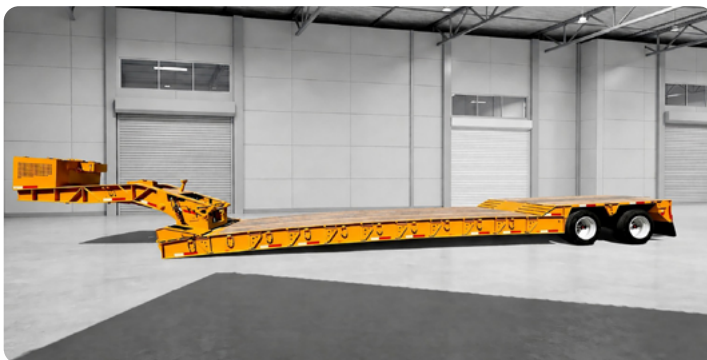
Imagen de carácter ilustrativo